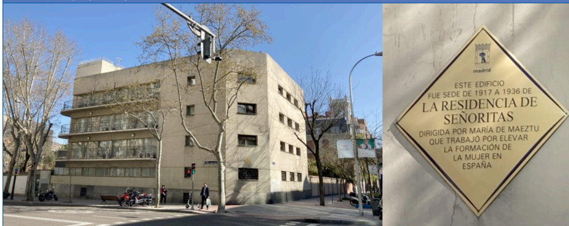
Figura 2. Edificio de la Residencia de Señoritas, año 2021. Esquina de las calles Fortuny y Martínez Campos, Madrid.

Colaboró en 1917-1918 en la Sección de Ciencias Naturales, Fisiología, Higiene y Agricultura del Instituto Escuela, sección que dirigía el catedrático Ignacio Bolívar y Urrutia (1850-1944). Siguió su actividad formativa en diversas áreas de Ciencias, y en Magisterio secundario (memoria de la JAE, 1918-19).